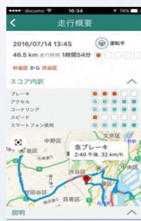
安全運転のヒント