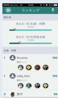
ランキング・バッジ獲得